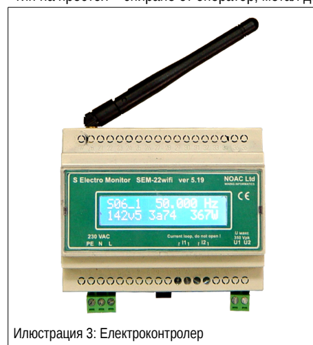
Илюстрация 3: Електроконтролер