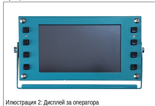
Илюстрация 2: Дисплей за оператора