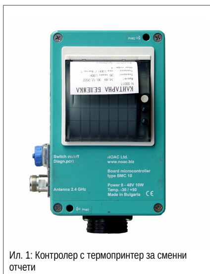
Ил. 1: Контролер с термопринтер за сменни отчети